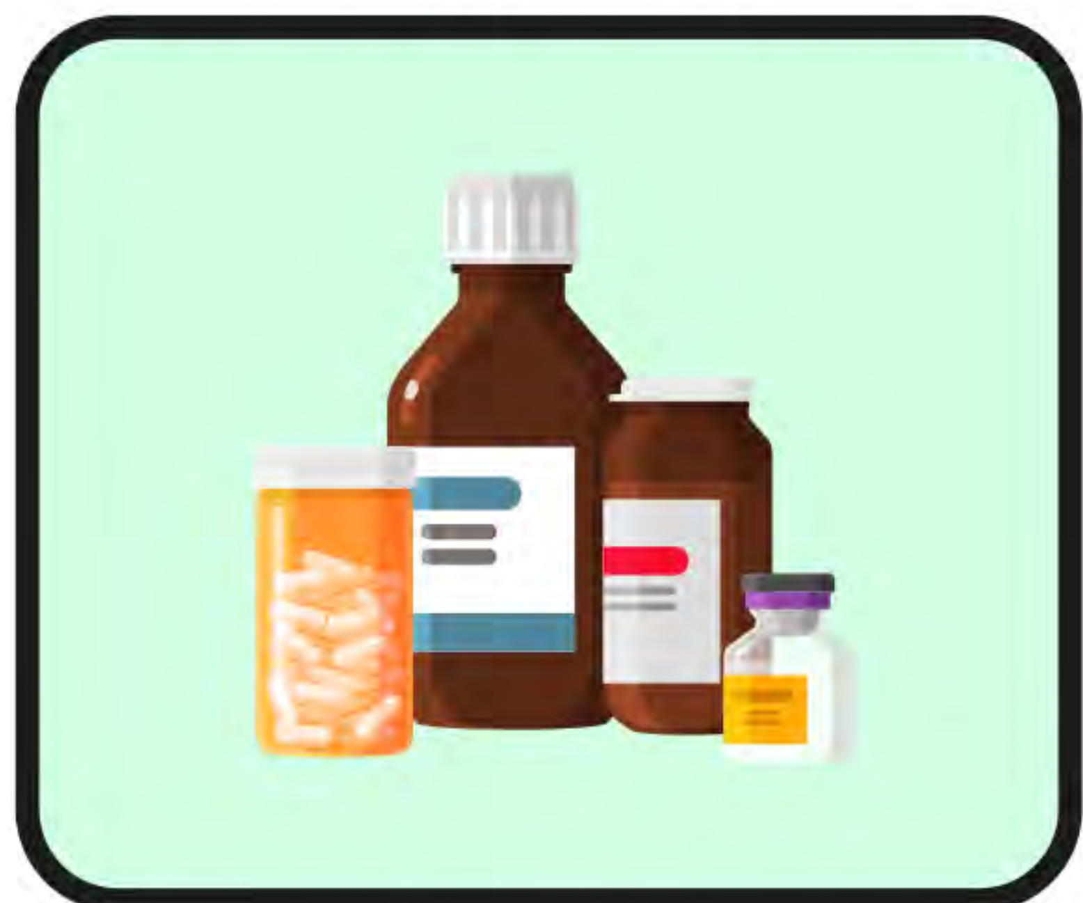
위해 식·의약품 직구